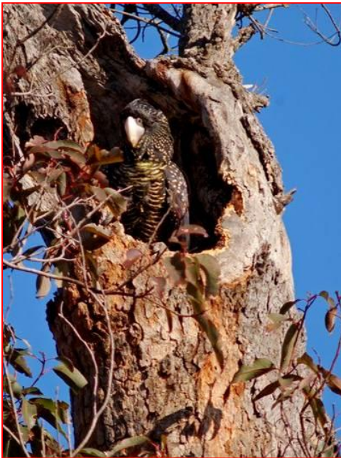
雌アカオクロオウムの巣